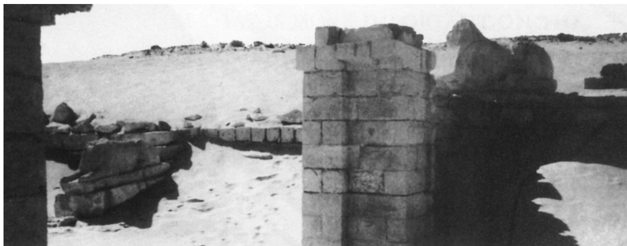
Ruiny w Fajum w Egipcie. W 1930 roku znaleziono tam liczne księgi manichejskie.

„Twoje pytanie jest dziwne. Albowiem wielkie jest słowo o które pytasz, dlatego wielka jest we mnie radość z powodu Prawdy, którą ogłaszam. Ponieważ Prawda ta, gdy ją ogłaszam, większa jest niż moje usta i większa niż wówczas, gdy znajduje się w moim sercu. Ty sam żyjesz w radości z jej powodu. Ale także i inni, którzy słyszą ją od ciebie, cieszą się i zostają oświeceni przez nią. Przez nią otrzymują nieprzemijającą Siłę. Wygląda to tak, jak w sytuacji dziecka, które zostaje poczęte w łonie matki. Zagnieżdża się ono w jej łonie i wypełnia je. Matka wie i poznaje, że dziecko, z którym jest w ciąży, żyje w niej. Cieszy się z powodu tego dziecka, aż nadejdzie godzina porodu i zobaczy, że wszystkie jego członki są doskonale piękne i bez odchy-